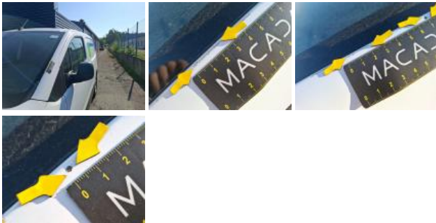
Porte AVG, Bosse(s) et griffe(s), LI - Réparer et peindre (complet)