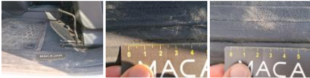
Montant de toit G, Griffe(s), Peindre