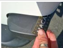
Feu ARG, Griffe(s), E - Remplacer