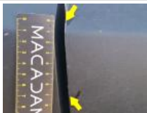
Pare-chocs AR, Griffe(s), Acceptable