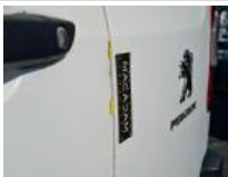
Carrosserie, Pas d'origine, Délettrage