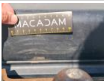
Coin pare-chocs ARD, Griffe(s), Acceptable