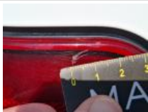
Feu ARD, Griffe(s), E - Remplacer