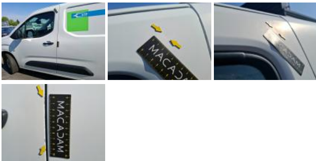
Panneau ARG, Bosse(s) et griffe(s), LI - Réparer et peindre (complet)