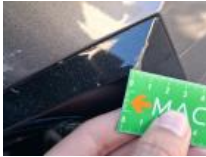
Moulure d'aile ARD, Griffe(s), E - Remplacer