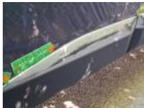
Moulure porte ARD, Griffe(s), E - Remplacer