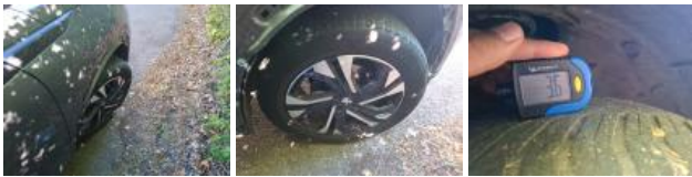
Jante alum. AVD bi-ton/polychrome, Griffe(s), Réparer/rempl. (montant forfaitaire)