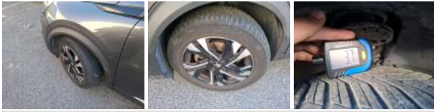
Pneu AVD, Hors tolérance, E - Remplacer