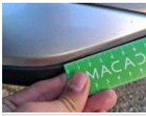
Moulure de pare-chocs AVG, Griffe(s), Peindre