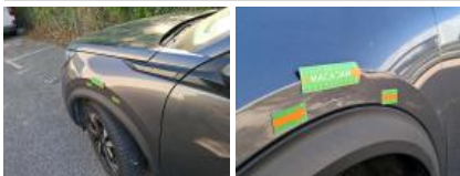
Moulure d'aile AVG, Griffe(s), E - Remplacer