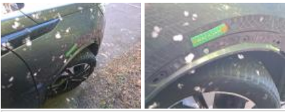
Moulure de pare-chocs AR, Déformé / Forcé, Le - Remplacer et peindre