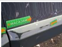
Moulure porte AVD, Griffe(s), E - Remplacer