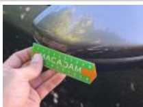
Moulure d'aile AVD, Manque, E - Remplacer