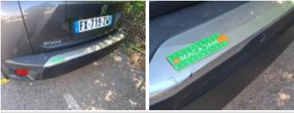
Coin pare-chocs ARD, Griffe(s), Acceptable