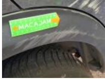
Porte ARD, Bosse(s) et griffe(s), LI - Réparer et peindre (complet)