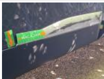
Moulure porte AVD, Griffe(s), Peindre