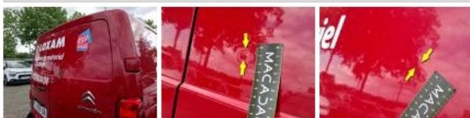
Carrosserie, Pas d'origine, Délettrage