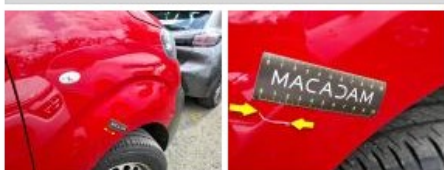
Porte de malle AR G, Bosse(s) et griffe(s), LI - Réparer et peindre (complet)