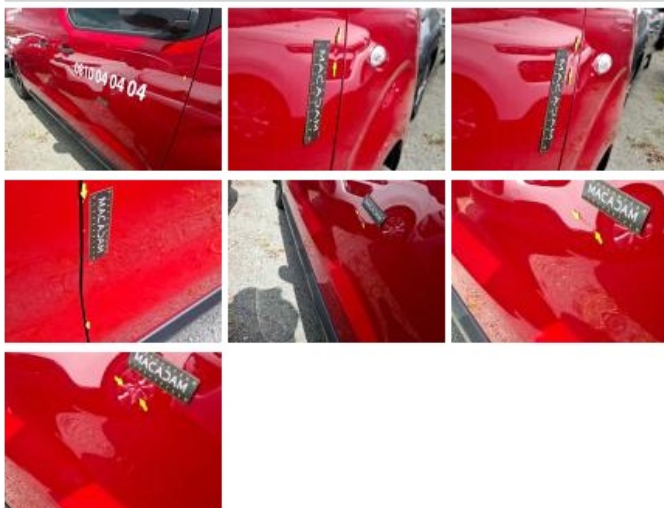
Aile AVD, Griffes(s), Acceptable