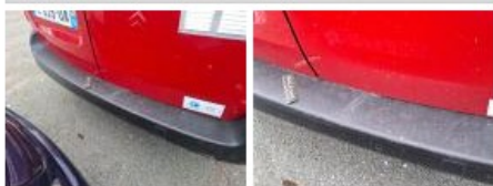
Porte de malle AR D, Bosse(s), Acceptable