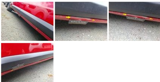
Porte AVD, Bosse(s) et griffe(s), LI - Réparer et peindre (complet)