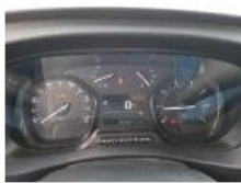
Intérieur, Tache, Nettoyer