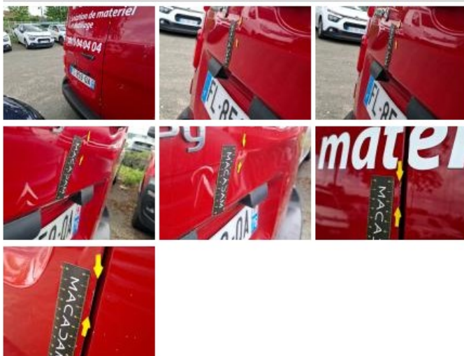
Pare-chocs AR, Griffes(s), E - Remplacer