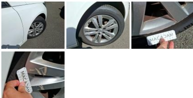
Jante alum. ARD, Griffe(s), E - Remplacer