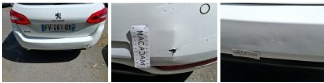
Jupe AR, Griffe(s), E - Remplacer