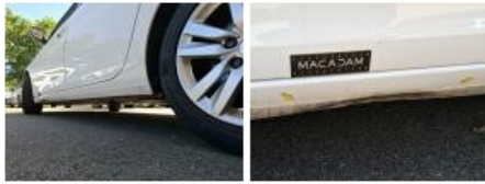
Porte AVG, Griffe(s), Acceptable