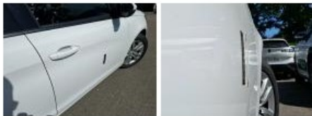
Porte ARD, Griffe(s), Acceptable