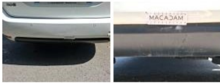
Obturbateur /Cache AR, Dégrafé, Dépose/Répose