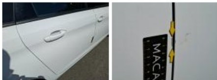
Aile ARD, Bosse(s), LI - Réparer et peindre (complet)