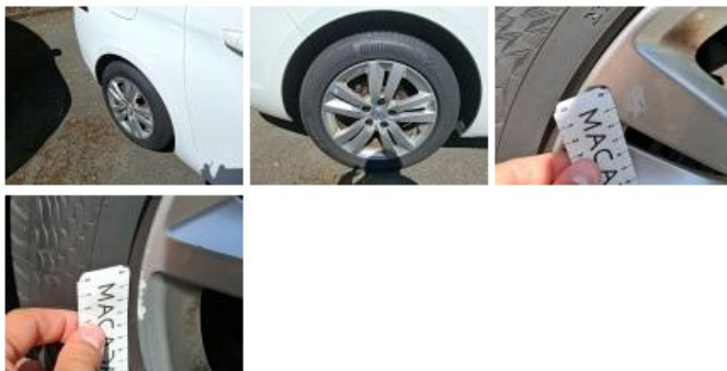
Jante alum. ARG, Griffe(s), Acceptable