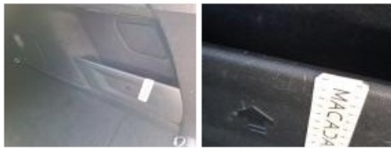
Garnit. zone de chargement, Griffe(s), Réparer/rempl. (montant forfaitaire)