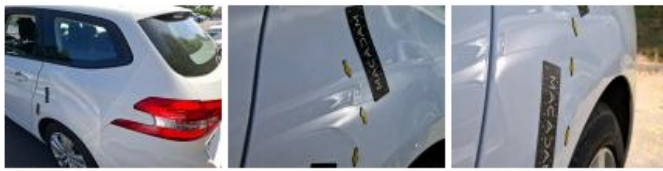
Bas de caisse ext G, Bosse(s) et griffe(s), LI - Réparer et peindre (complet)