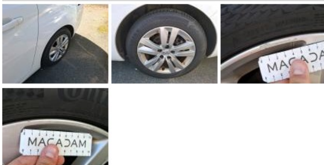
Jante alum. AVG, Griffe(s), E - Remplacer