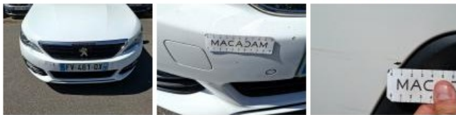
Moulure de pare-chocs AVD, Griffe(s), E - Remplacer