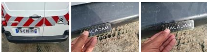
Carrosserie, Pas d'origine, Acceptable