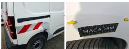
Pare-chocs AR, Griffe(s), Acceptable