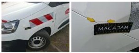
Panneau ARG, Bosse(s) et griffe(s), LI - Réparer et peindre (complet)