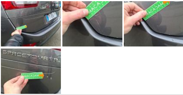
Carrosserie, Grêlé, PDR Niveau 2