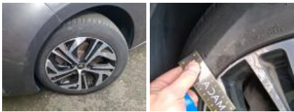
Jante alum. ARG bi-ton/polychrome, Griffe(s), Réparer/rempl. (montant forfaitaire)