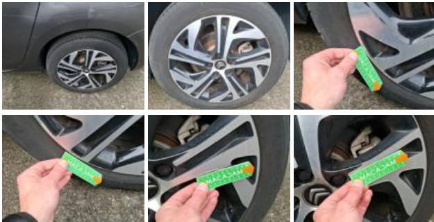
Pneu ARG, Déchirure, E - Remplacer