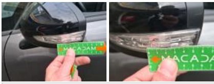
Boîtier rétroviseur ext G, Griffe(s), Peindre