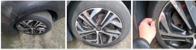
Pneu AVG, Déchirure, E - Remplacer