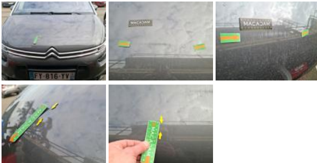
Moulure de pare-chocs AVD, Griffe(s), E - Remplacer