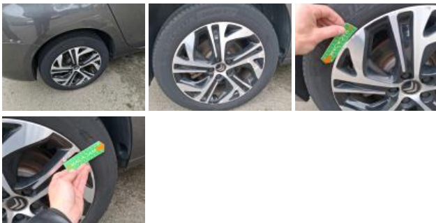
Pneu ARD, Déchirure, E - Remplacer