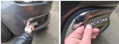
Moulure de pare-chocs AVG, Griffe(s), E - Remplacer