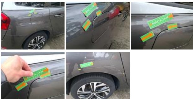
Répétiteur D, Griffe(s), E - Remplacer