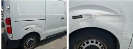
Porte de malle AR D, Bosse(s) et griffe(s), Acceptable