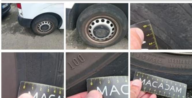
Pneu AVG, Déchirure, E - Remplacer