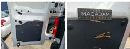
Joint de coffre/hayon, Déchirure, E - Remplacer