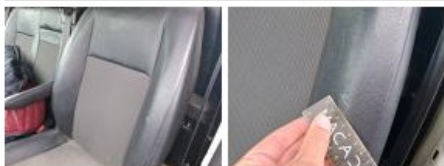
Revêtement assise siège AVD, Tache, Nettoyer