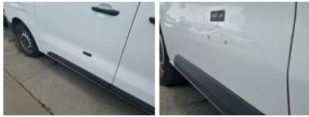
Panneau ARD, Bosse(s) et griffe(s), LI - Réparer et peindre (complet)