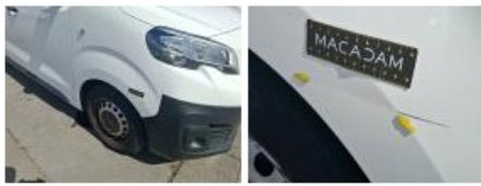
Porte coulissante D, Bosse(s), LI - Réparer et peindre (complet)