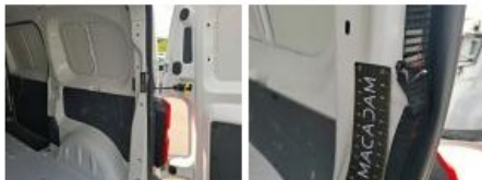
Garnit. int G coffre, Cassé, E - Remplacer