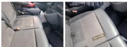
Revêtement assise siège AVD, Tache, Nettoyer