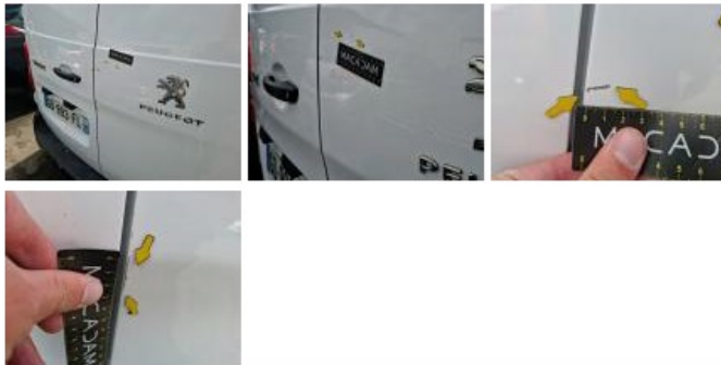
Garniture porte de malle ARG, Cassé, E - Remplacer