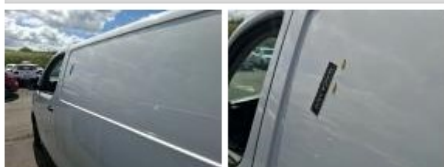
Aile AVD, Bosse(s) et griffe(s), LI - Réparer et peindre (complet)