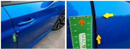
Bas de caisse ext D, Bosse(s), LI - Réparer et peindre (complet)