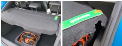
Garnit. zone de chargement, Griffe(s), Réparer/rempl. (montant forfaitaire)