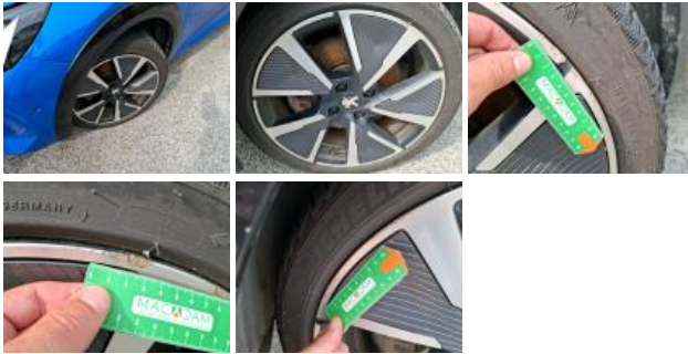
Jante alum. ARG bi-ton/polychrome, Griffe(s), Réparer/rempl. (montant forfaitaire)