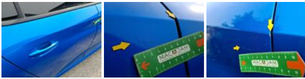
Porte AVD, Griffe(s), Acceptable