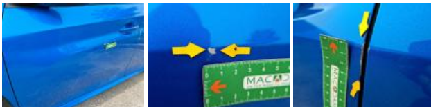
Porte ARG, Griffe(s), Acceptable