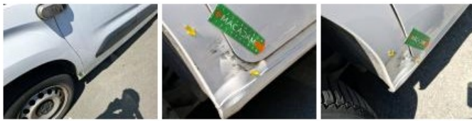
Boitier rétroviseur ext D, Griffe(s), Acceptable