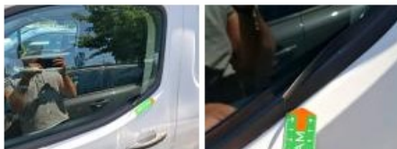
Porte AVG, Bosse(s) et griffe(s), Acceptable