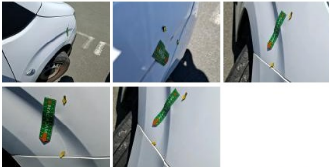
Porte de malle AR G, Bosse(s) et griffe(s), LI - Réparer et peindre (complet)