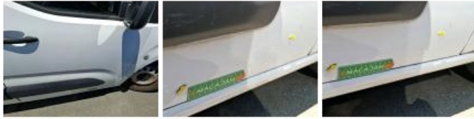
Aile AVD, Bosse(s) et griffe(s), LI - Réparer et peindre (complet)