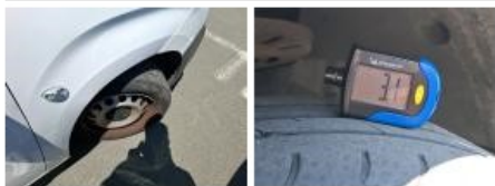
Pneu ARD, Déchirure, E - Remplacer