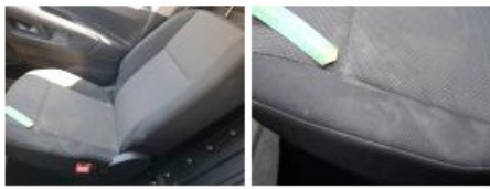
Revêtement assise siège AVG, Tache, Nettoyer