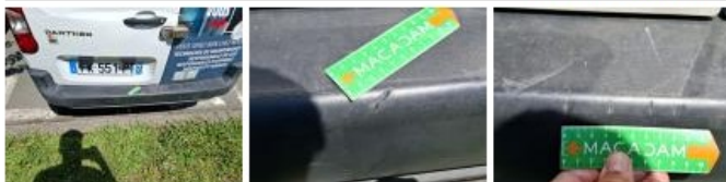
Obturbateur /Cache AR, Déformé / Forcé, E - Remplacer