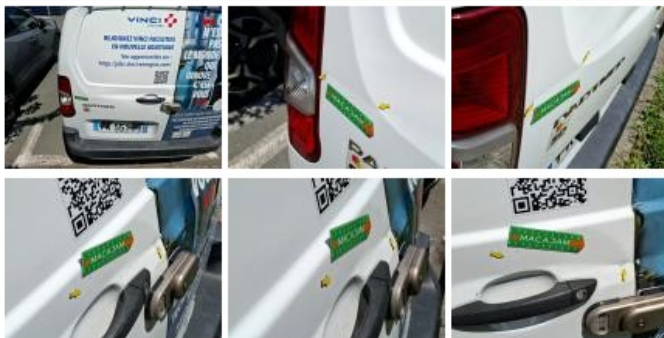
Porte de malle AR D, Bosse(s) et griffe(s), LI - Réparer et peindre (complet)