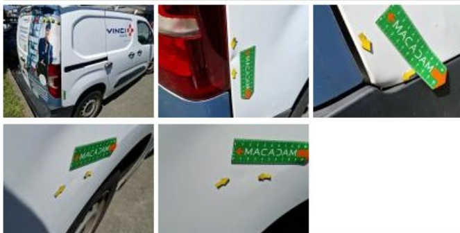
Bas de caisse ext D, Bosse(s) et griffe(s), LI - Réparer et peindre (complet)