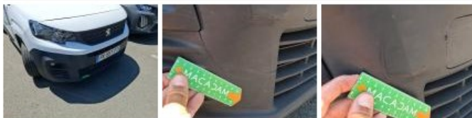
Moulure de pare-chocs AV, Griffe(s), Peindre