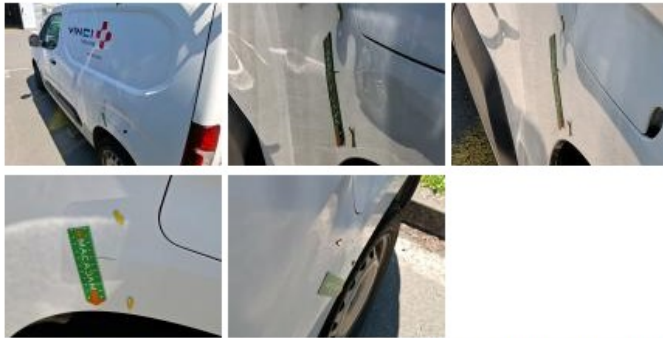
Jt ext lèche-vitre AVG, Déchirure, E - Remplacer