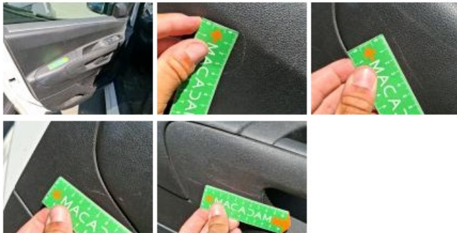
Garniture porte AVD, Griffe(s), Réparer/rempl. (montant forfaitaire)