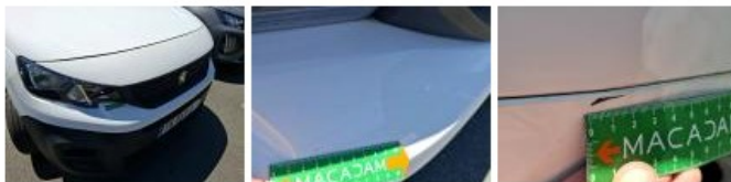
Panneau ARD, Bosse(s) et griffe(s), LI - Réparer et peindre (complet)