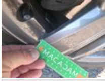
Jante alum. AVD, Griffe(s), Réparer/rempl. (montant forfaitaire)