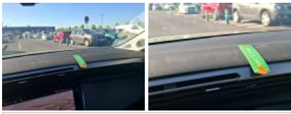
Intérieur, Tache, Nettoyer