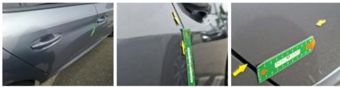
Poignée ext porte AVD, Griffe(s), Peindre