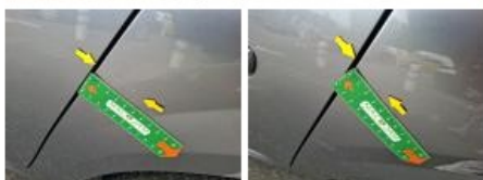
Pare-chocs AV, Griffe(s), Peindre