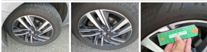
Jante alum. ARD bi-ton/polychrome, Griffe(s), Acceptable