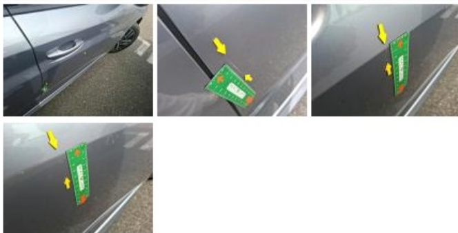
Aile AVD, Griffe(s), Peindre