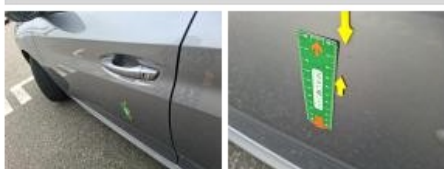
Aile ARG, Bosse(s) et griffe(s), LI - Réparer et peindre (complet)