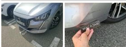
Aile ARD, Bosse(s) et griffe(s), LI - Réparer et peindre (complet)