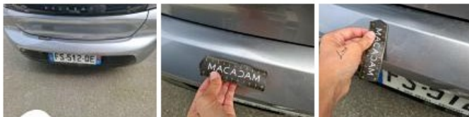
Moulure de pare-chocs AR, Déformé / Forcé, Le - Remplacer et peindre