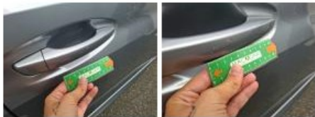
Porte AVD, Griffe(s), Peindre