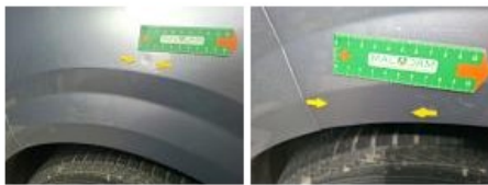
Porte ARD, Bosse(s) et griffe(s), LI - Réparer et peindre (complet)