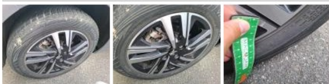
Jante alum. AVD bi-ton/polychrome, Griffe(s), Réparer/rempl. (montant forfaitaire)