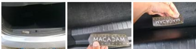
Pare-chocs AR, Déformé / Forcé, Le - Remplacer et peindre