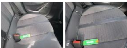
Revêtement assise siège AVG, Tache, Nettoyer