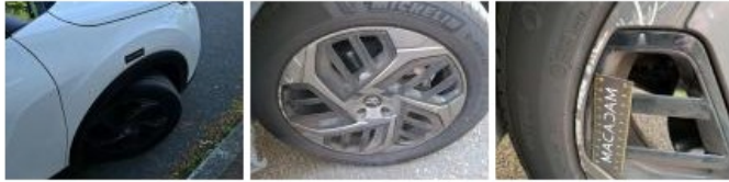
Aile AVG, Bosse(s), Acceptable