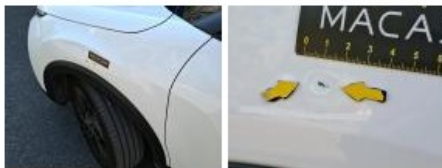
Capot, Eclat(s), Acceptable