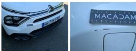
Porte ARD, Bosse(s) et griffe(s), Acceptable