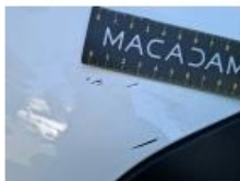
Pare-chocs AR, Griffe(s), Acceptable