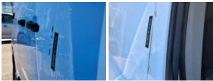
Moulure porte AVD, Griffe(s), Réparer/rempl. (montant forfaitaire)