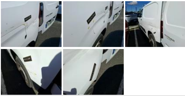
Moulure porte AVG, Griffe(s), Réparer/rempl. (montant forfaitaire)