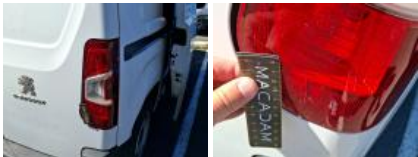
Porte de malle AR G, Bosse(s) et griffe(s), LI - Réparer et peindre (complet)