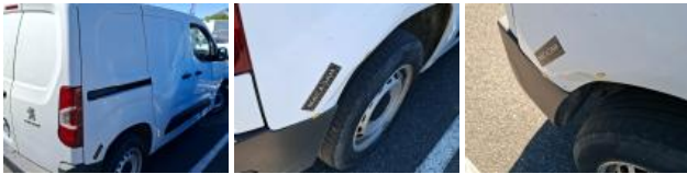
Bas de caisse ext D, Bosse(s) et griffe(s), LI - Réparer et peindre (complet)