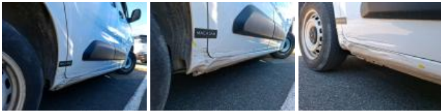
Porte coulissante D, Bosse(s) et griffe(s), LI - Réparer et peindre (complet)