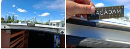
Garnit. int G coffre, Griffe(s), Réparer/rempl. (montant forfaitaire)