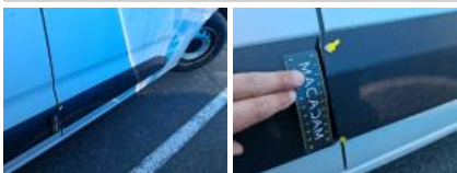
Aile AVD, Bosse(s) et griffe(s), LI - Réparer et peindre (complet)