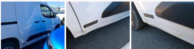
Porte AVD, Bosse(s) et griffe(s), LI - Réparer et peindre (complet)