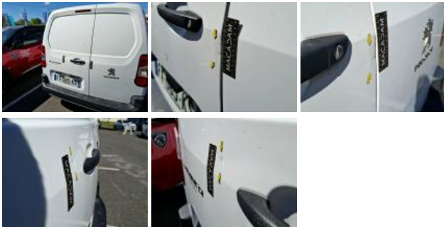
Porte de malle AR D, Bosse(s) et griffe(s), LI - Réparer et peindre (complet)