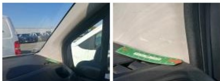
Couvercle vide poches, Griffe(s), Réparer/rempl. (montant forfaitaire)