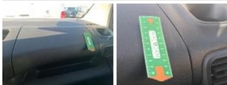
Grille vent. D, Endommagé, Acceptable