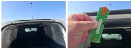
Garnit. int D coffre, Dégâts chimiques, E - Remplacer