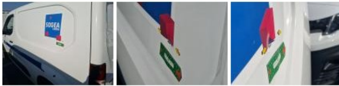
Porte coulissante D, Bosse(s), LI - Réparer et peindre (complet)