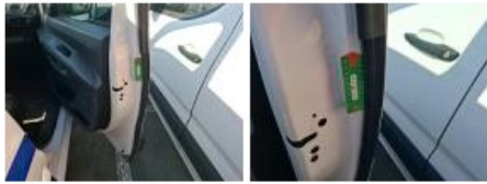
Aile AVG, Griffe(s), Lustrage