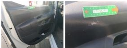
Garniture intérieur, Dégâts chimiques, E - Remplacer