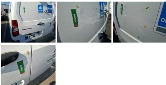
Porte de malle AR D, Bosse(s), LI - Réparer et peindre (complet)