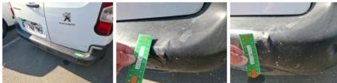
Coin pare-chocs ARD, Griffe(s), Acceptable