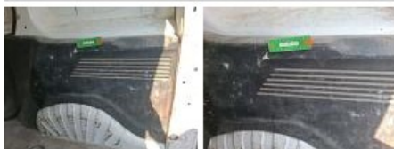
Garniture porte coulissante D, Tache, E - Remplacer