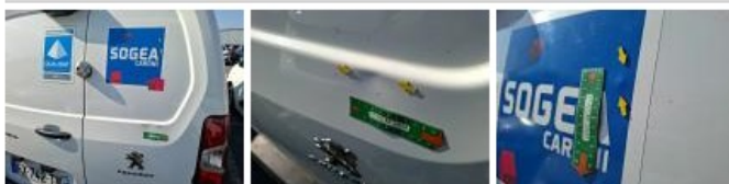
Garnit. int G coffre, Griffe(s), Réparer/rempl. (montant forfaitaire)