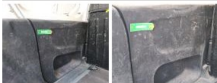
Garniture porte de malle ARG, Dégâts chimiques, E - Remplacer