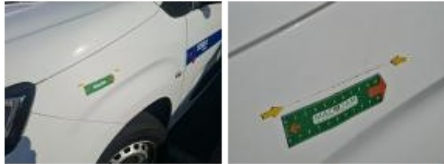
Panneau ARG, Bosse(s) et griffe(s), LI - Réparer et peindre (complet)