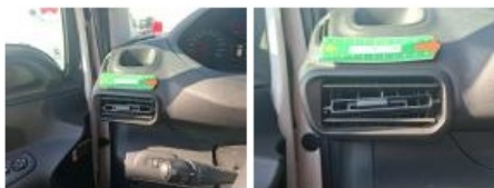
Tableau de bord, Griffe(s), Forfait