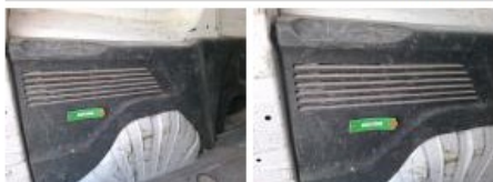
Garnit. int G coffre, Griffe(s), Réparer/rempl. (montant forfaitaire)