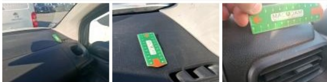
Garnit. montant AVD, Griffe(s), Réparer/rempl. (montant forfaitaire)