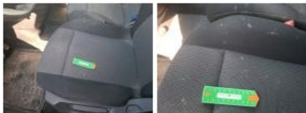
Revêtement assise siège AVD, Dégâts chimiques, E - Remplacer