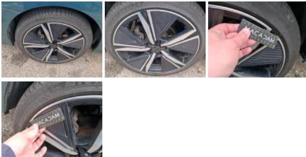
Jante alum. AVD bi-ton/polychrome, Griffe(s), Réparer/rempl. (montant forfaitaire)