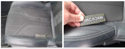
Revêtement assise siège AVD, Tache, Nettoyer