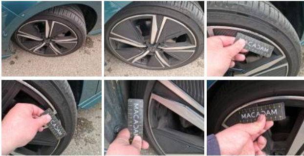
Jante alum. ARD bi-ton/polychrome, Griffe(s), Réparer/rempl. (montant forfaitaire)