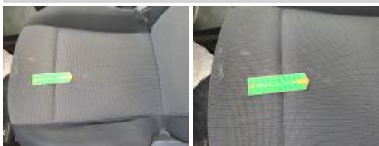
Revêtement dossier AVG, Tache, Nettoyer