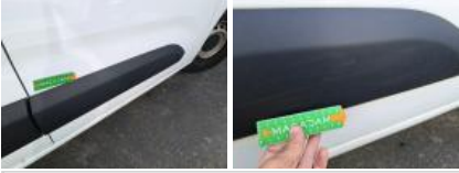
Porte de malle AR G, Bosse(s) et griffe(s), LI - Réparer et peindre (complet)