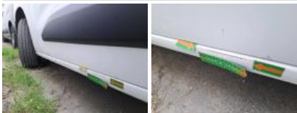
Moulure porte ARG, Griffe(s), Réparer/rempl. (montant forfaitaire)