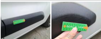
Panneau ARG, Griffe(s), Peindre