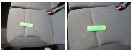
Revêtement assise siège AVG, Tache, Nettoyer