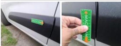
Bas de caisse ext G, Griffe(s), Peindre