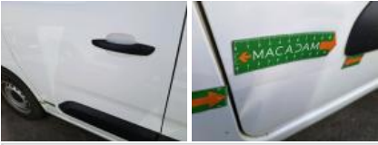
Moulure porte AVD, Griffe(s), E - Remplacer