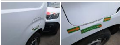
Panneau ARD, Bosse(s), Acceptable