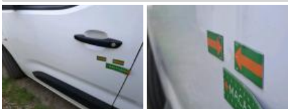
Moulure porte AVG, Griffe(s), Réparer/rempl. (montant forfaitaire)