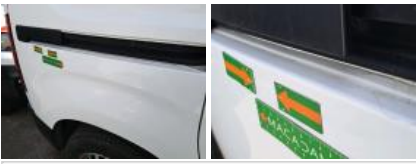
Porte coulissante D, Bosse(s) et griffe(s), LI - Réparer et peindre (complet)