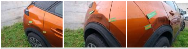
Porte AR, Bosse(s) et griffe(s), LI - Réparer et peindre (complet)