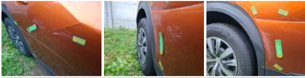
Moulure porte ARD, Griffe(s), Acceptable