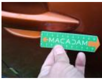
Boitier rétroviseur ext D, Griffe(s), Peindre