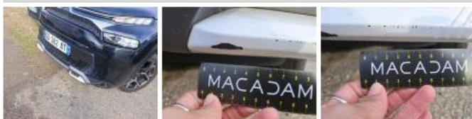
Pare-chocs AV, Griffe(s), Lustrage