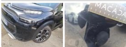
Catadioptré, Cassé, E - Remplacer