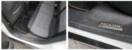
Joint de porte ARD, Déchirure, E - Remplacer