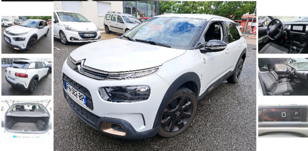
CITROEN C4 Cactus PureTech 110 S&S EAT: FH-562-BP