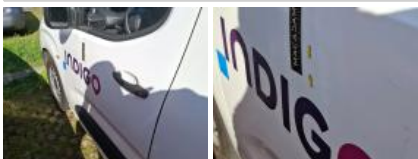
Moulure porte AVG, Griffe(s), Réparer/rempl. (montant forfaitaire)