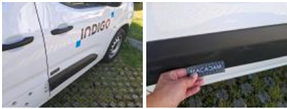
Porte AVD, Bosse(s), Acceptable