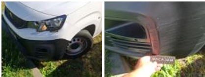
Pare-chocs AV, Dégrafé, Dépose/Repose