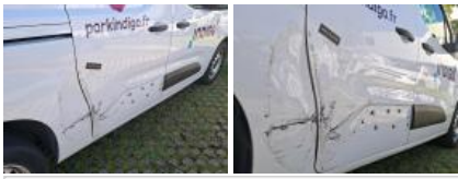
Moulure porte ARD, Manque, E - Remplacer