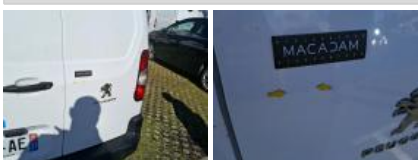
Coin pare-chocs ARG, Griffe(s), Acceptable