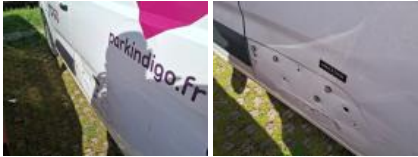
Panneau ARG, Bosse(s) et griffe(s), LI - Réparer et peindre (complet)