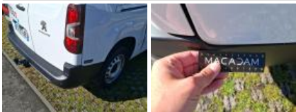
Porte de malle AR G, Bosse(s) et griffe(s), LI - Réparer et peindre (complet)