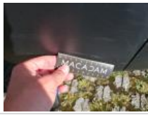
Carrosserie, Pas d'origine, Délettrage