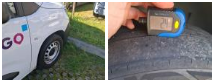
Pneu ARD, Déchirure, E - Remplacer