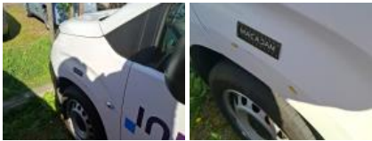
Boitier rétroviseur ext G, Griffe(s), Acceptable