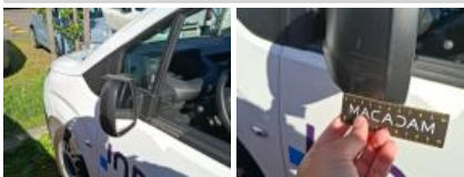
Porte AVG, Bosse(s), Acceptable