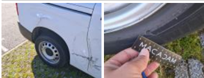
Pneu ARG, Déchirure, E - Remplacer