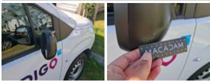
Aile AVD, Griffe(s), Acceptable