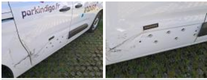
Moulure porte AVD, Griffe(s), E - Remplacer