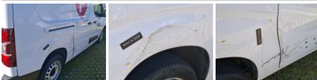
Porte coulissante D, Bosse(s) et griffe(s), LI - Réparer et peindre (complet)