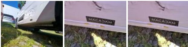
Pare-chocs AV, Griffe(s), Acceptable