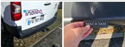
Coin pare-chocs ARD, Dégrafé, Dépose/Repose