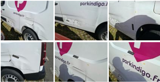
Bas de caisse ext G, Bosse(s) et griffe(s), LI - Réparer et peindre (complet)