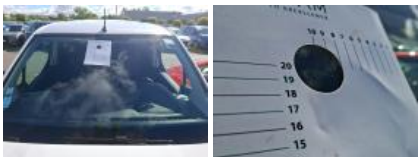
Kit collage vitrage, Nécessaire repose vitrage, Réparer/rempl. (montant forfaitaire)