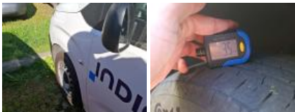
Aile AVG, Griffe(s), Lustrage