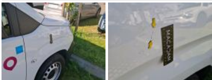
Pare-chocs AR, Griffe(s), Acceptable