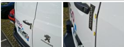
Porte de malle AR D, Griffe(s), Lustrage