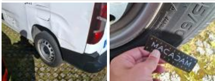
Pneu AVG, Déchirure, E - Remplacer