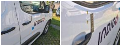
Boitier rétroviseur ext D, Griffe(s), E - Remplacer