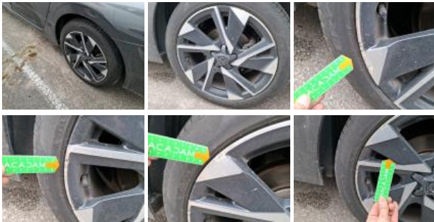
Jante alum. AVG bi-ton/polychrome, Griffé(s), E - Remplacer