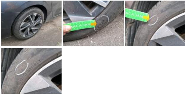
Jante alum. ARG bi-ton/polychrome, Déformé / Forcé, E - Remplacer