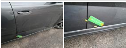
Bas de caisse ext D, Bosse(s) et griffe(s), Le - Remplacer et peindre