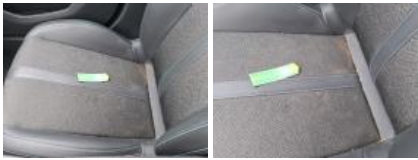
Revêtement assise siège AVG, Tache, Nettoyer