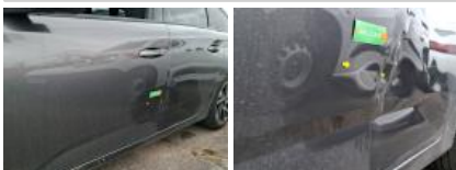
Porte ARG, Bosse(s) et griffe(s), LI - Réparer et peindre (complet)