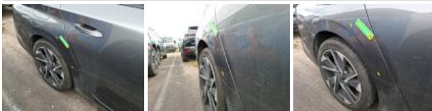
Porte ARD, Griffe(s), Lustrage