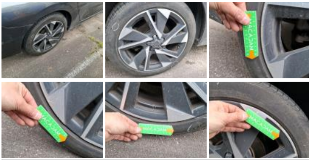
Pneu ARD, Déchirure, E - Remplacer