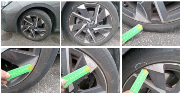
Pneu AVG, Déchirure, E - Remplacer