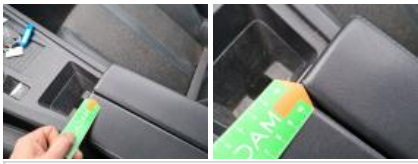
Garniture intérieur, Usé, Acceptable