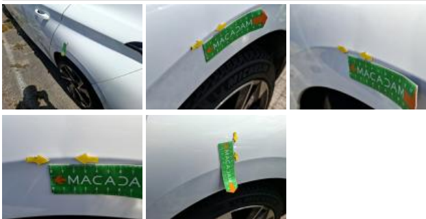
Aile ARD, Bosse(s) et griffe(s), LI - Réparer et peindre (complet)