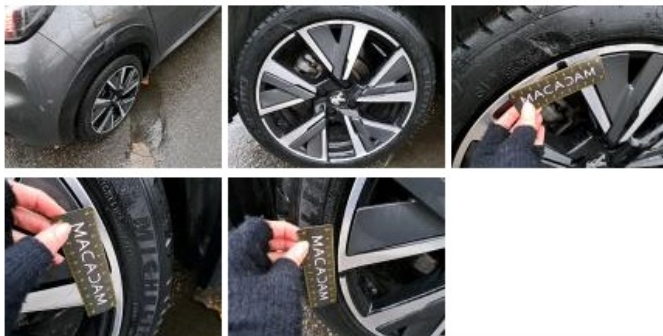
Pneu ARD, Déchirure, E - Remplacer