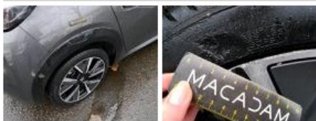
Jante alum. AVD bi-ton/polychrome, Griffe(s), Réparer/rempl. (montant forfaitaire)