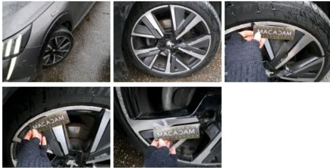
Jante alum. ARG bi-ton/polychrome, Griffe(s), Réparer/rempl. (montant forfaitaire)