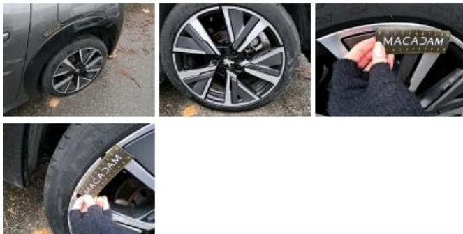
Jante alum. ARD bi-ton/polychrome, Griffe(s), Réparer/rempl. (montant forfaitaire)