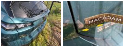
Pare-chocs AR, Déformé / Forcé, LI - Réparer et peindre (complet)