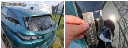
Coffre / hayon, Bosse(s) et griffe(s), LI - Réparer et peindre (complet)