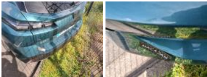
Moulure de pare-chocs AR, Griffe(s), E - Remplacer