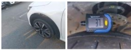
Pneu ARD, Hors tolérance, E - Remplacer