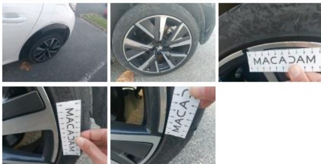
Jante alum. ARD bi-ton/polychrome, Griffe(s), E - Remplacer