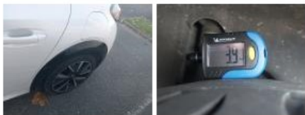
Jante alum. ARG bi-ton/polychrome, Griffe(s), Réparer/rempl. (montant forfaitaire)