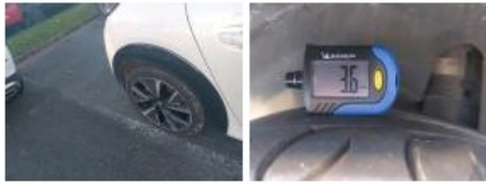
Pneu AVD, Hors tolérance, E - Remplacer