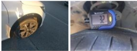
Jante alum. AVG bi-ton/polychrome, Griffe(s), Réparer/rempl. (montant forfaitaire)