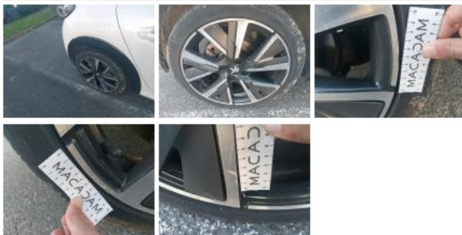
Jante alum. AVD bi-ton/polychrome, Griffe(s), E - Remplacer