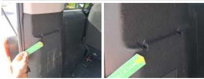
Garnit. couvercle AR, Griffe(s), Réparer/rempl. (montant forfaitaire)