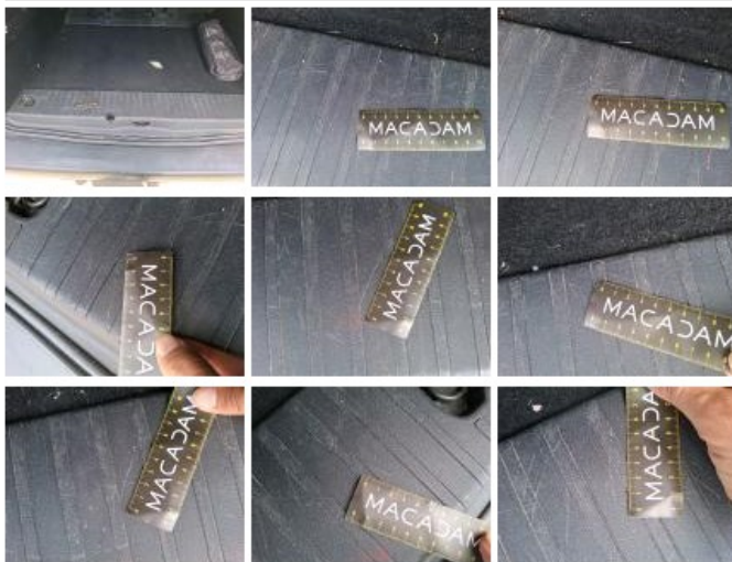
Garnit. int D coffre, Griffe(s), Réparer/rempl. (montant forfaitaire)