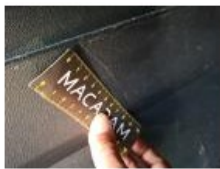
Carrosserie, Résidu de colle, Petit délettrage