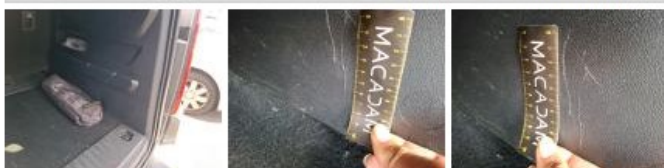
Garnit. int G coffre, Griffe(s), Réparer/rempl. (montant forfaitaire)