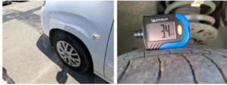
Pneu ARG, Hors tolérance, E - Remplacer