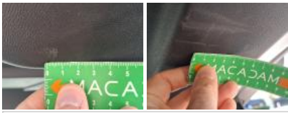
Moulure de coffre, Griffe(s), Lustrage