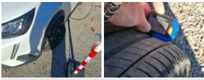
Pneu ARD, Hors tolérance, E - Remplacer