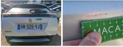
Moulure de pare-chocs AR, Griffe(s), Peindre