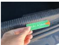
Garnit. couvercle AR, Griffe(s), Réparer/rempl. (montant forfaitaire)