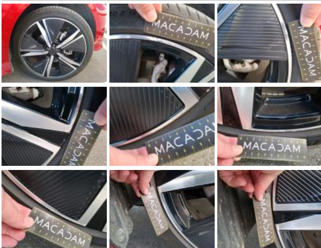
Jante alum. ARD bi-ton/polychrome, Griffe(s), Réparer/rempl. (montant forfaitaire)