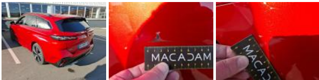
Jupe AR, Griffe(s), Acceptable