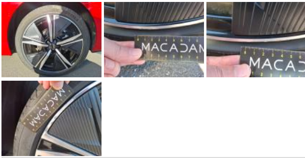
Jante alum. AVG bi-ton/polychrome, Griffe(s), Acceptable