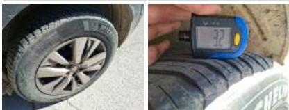
Pneu ARD, Hors tolérance, E - Remplacer