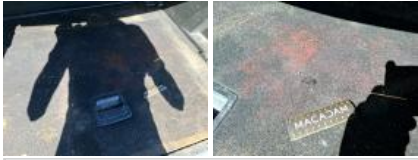
Garnit. couvercle AR, Griffe(s), Réparer/rempl. (montant forfaitaire)