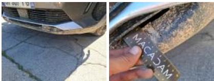
Grille de pare-chocs AV M, Dégrafé, Dépose/Repose