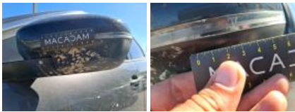
Moulure porte AVG, Dégâts chimiques, E - Remplacer