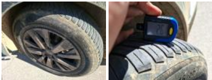
Pneu ARG, Hors tolérance, E - Remplacer