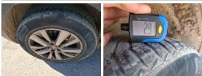
Pneu AVD, Hors tolérance, E - Remplacer