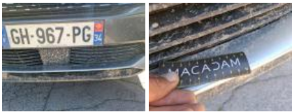
Moulure de pare-chocs AV, Fêlure, Le - Remplacer et peindre