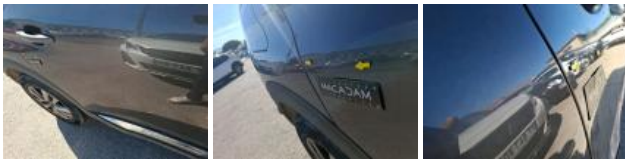
Porte AVD, Bosse(s), LI - Réparer et peindre (complet)