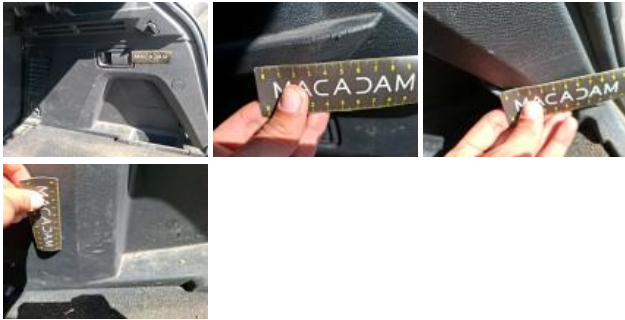
Garnit. int G coffre, Griffe(s), Réparer/rempl. (montant forfaitaire)