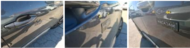
Moulure porte ARD, Déformé / Forcé, E - Remplacer