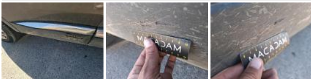
Moulure porte AVD, Dégâts chimiques, E - Remplacer