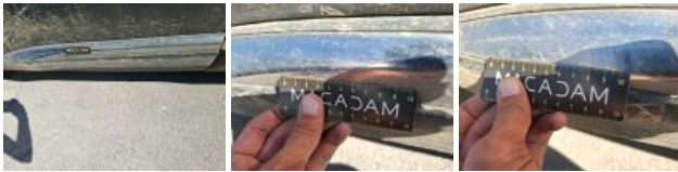
Moulure porte ARG, Dégâts chimiques, E - Remplacer