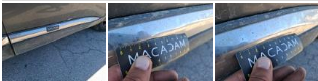
Moulure porte ARD, Dégâts chimiques, E - Remplacer