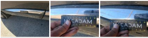
Cache bagages, Dégâts chimiques, E - Remplacer