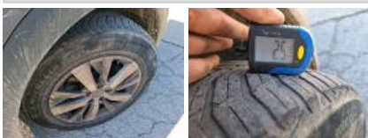
Jante alum. AVD, Griffes(s), Réparer/rempl. (montant forfaitaire)