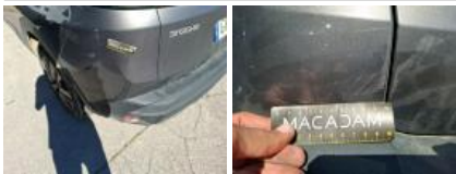
Coffre / hayon, Griffe(s), Peindre