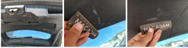
Garnit. int D coffre, Griffe(s), Réparer/rempl. (montant forfaitaire)