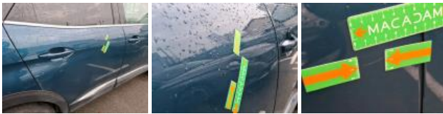
Porte AVD, Griffe(s), Peindre