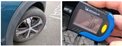
Jante alum. AVD bi-ton/polychrome, Griffe(s), Réparer/rempl. (montant forfaitaire)