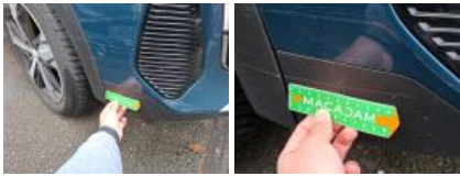
Moulure d'aile ARD, Griffe(s), Réparer/rempl. (montant forfaitaire)