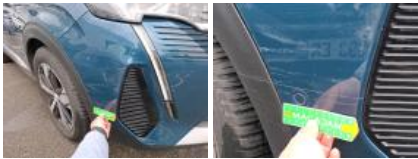
Spoiler AV, Griffe(s), E - Remplacer