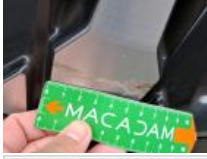
Jante alum. ARG bi-ton/polychrome, Griffe(s), Réparer/rempl. (montant forfaitaire)