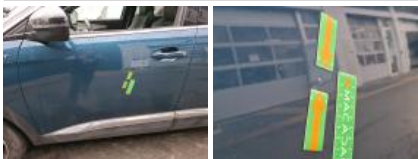
Aile ARG, Griffe(s), Peindre