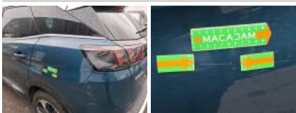
Moulure d'aile ARG, Griffe(s), Réparer/rempl. (montant forfaitaire)