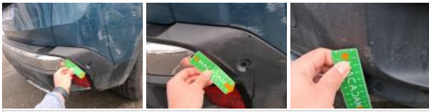
Coin pare-chocs ARD, Griffe(s), Peindre