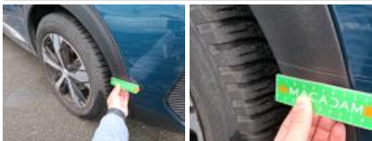
Coin pare-chocs ARG, Griffe(s), Peindre