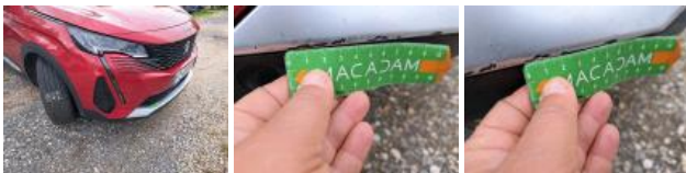
Pare-chocs AV, Cassé, Le - Remplacer et peindre