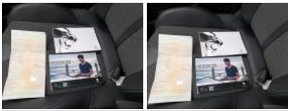
Revêtement assise siège AVG, Déchirure, E - Remplacer