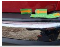
Moulure de pare-chocs AR, Griffes(s), E - Remplacer