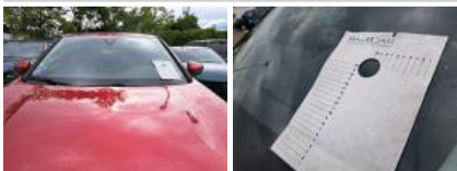
Kit collage vitrage, Nécessaire repose vitrage, Réparer/rempl. (montant forfaitaire)