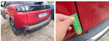
Coffre / hayon, Griffe(s), Peindre