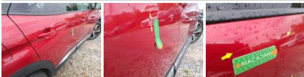
Porte AVD, Bosse(s) et griffe(s), LI - Réparer et peindre (complet)