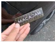
Pare-chocs AR, Griffe(s), Réparer/rempl. (montant forfaitaire)