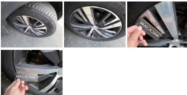
Jante alum. ARD bi-ton/polychrome, Griffes(s), Réparer/rempl. (montant forfaitaire)