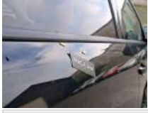
Garnit. couvercle AR, Griffe(s), Réparer/rempl. (montant forfaitaire)