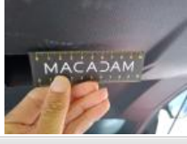
Coin pare-chocs ARD, Griffe(s), Lustrage