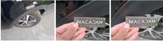
Moulure de pare-chocs AV, Cassé, Le - Remplacer et peindre