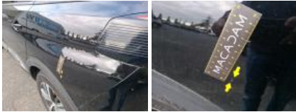
Moulure d'aile AVG, Griffe(s), Réparer/rempl. (montant forfaitaire)