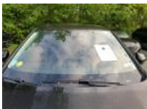
Pare-brise, Eclat(s), E - Remplacer