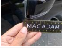
Moulure d'aile AVD, Dégrafé, Dépose/Repose