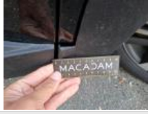
Porte ARD, Bosse(s), LI - Réparer et peindre (complet)