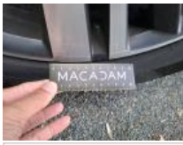
Jante alum. ARG bi-ton/polychrome, Griffe(s), Réparer/rempl. (montant forfaitaire)