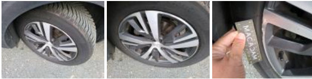
Aile ARG, Griffe(s), Lustrage