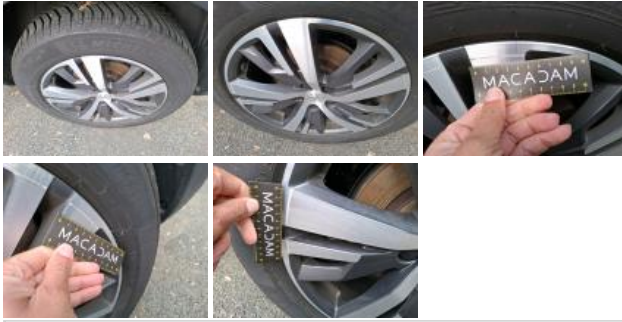
Jante alum. AVG bi-ton/polychrome, Griffe(s), E - Remplacer