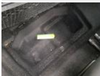
Kit réparation pneu, Manque, Réparer/rempl. (montant forfaitaire)