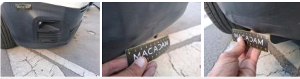
Pare-chocs AV, Mauvaise réparation, Peindre