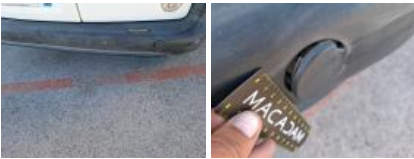
Carrosserie, Pas d'origine, Délettrage