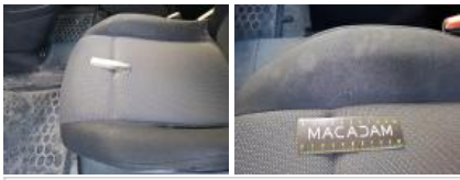
Revêtement assise siège AVD, Tache, Nettoyer