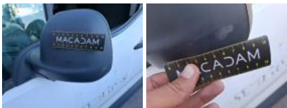
Moulure porte AVG, Griffe(s), Réparer/rempl. (montant forfaitaire)