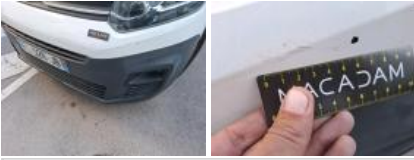
Bas de caisse ext D, Bosse(s) et griffe(s), LI - Réparer et peindre (complet)