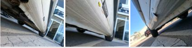
Porte coulissante D, Bosse(s) et griffe(s), LI - Réparer et peindre (complet)