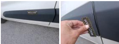
Panneau Latéral G, Bosse(s), LI - Réparer et peindre (complet)