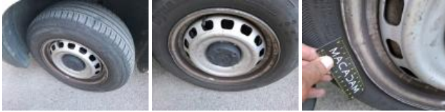
Jante tôle AVD, Déformé / Forcé, Acceptable