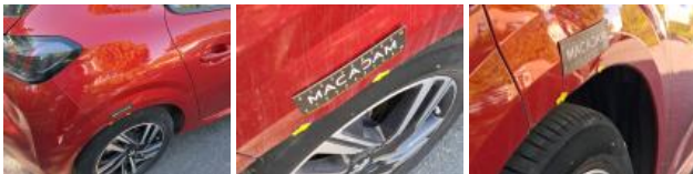
Porte AVD, Différence de teinte, Peindre