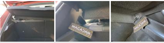
Coffre / hayon, Mauvaise réparation, Peindre