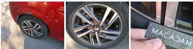
Pneu AVD, Hors tolérance, E - Remplacer