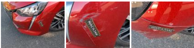
Aile ARD, Bosse(s), LI - Réparer et peindre (complet)