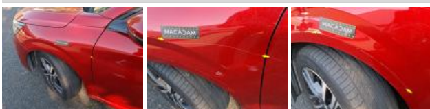
Porte AVG, Bosse(s) et griffe(s), LI - Réparer et peindre (complet)