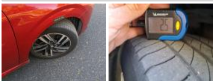
Jante alum. AVD bi-ton/polychrome, Griffe(s), E - Remplacer