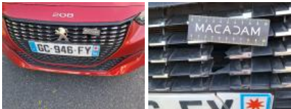
Plaque immat AV, Déformé / Forcé, Réparer/rempl. (montant forfaitaire)