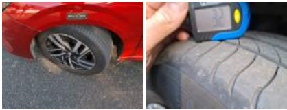
Jante alum. AVG bi-ton/polychrome, Griffe(s), Acceptable