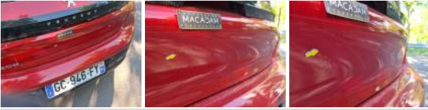
Pare-chocs AR, Griffe(s), Peindre