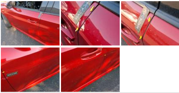
Porte ARG, Bosse(s) et griffe(s), LI - Réparer et peindre (complet)