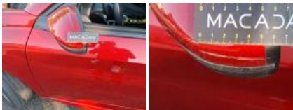
Répétiteur G, Cassé, E - Remplacer