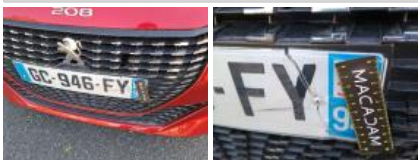
Pare-chocs AV, Griffe(s), LI - Réparer et peindre (complet)