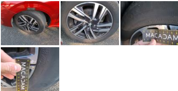
Jante alum. ARD bi-ton/polychrome, Griffe(s), Acceptable