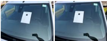
Kit collage vitrage, Nécessaire repose vitrage, Réparer/rempl. (montant forfaitaire)