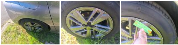
Jante alum. AVD, Griffe(s), Réparer/rempl. (montant forfaitaire)