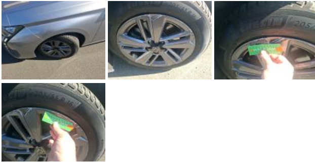
Jante alum. ARD, Griffe(s), Réparer/rempl. (montant forfaitaire)