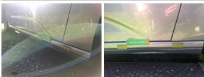
Jupe AR, Griffe(s), Réparer/rempl. (montant forfaitaire)