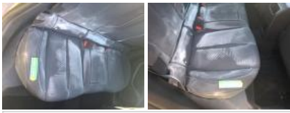
Revêtement dossier ARD, Tache, Nettoyer