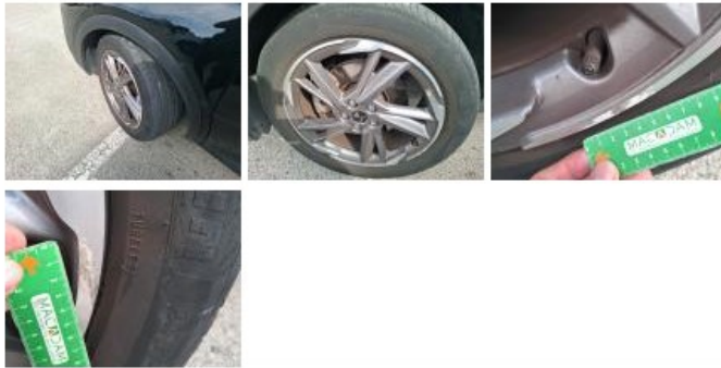
Jante alum. ARD bi-ton/polychrome, Griffe(s), Acceptable