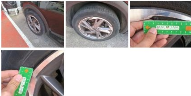
Pneu AVD, Hors tolérance, E - Remplacer