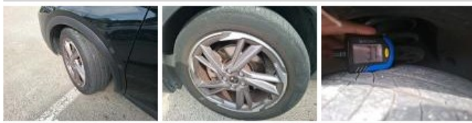
Jante alum. AVG bi-ton/polychrome, Griffe(s), Réparer/rempl. (montant forfaitaire)