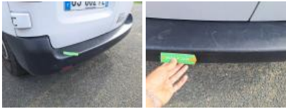
Feu ARD, Cassé, E - Remplacer