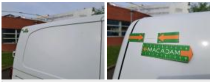
Joint de coffre/hayon, Déchirure, E - Remplacer