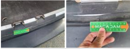
Feu ARG, Griffe(s), E - Remplacer