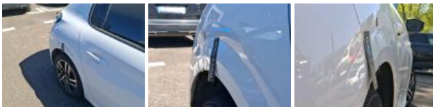
Pare-chocs AR, Griffe(s), Acceptable