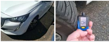
Pneu AVD, Hors tolérance, E - Remplacer