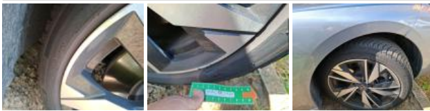
Aile ARG, Griffe(s), Peindre