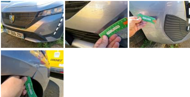
Moulure de pare-chocs AVD, Griffe(s), Réparer/rempl. (montant forfaitaire)