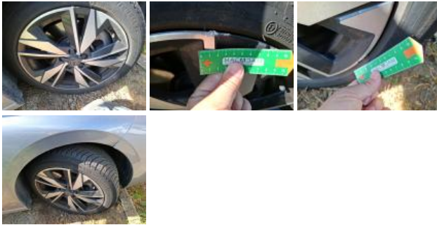
Pneu AVD, Déchirure, E - Remplacer