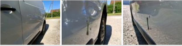
Capot, Griffe(s), Peindre