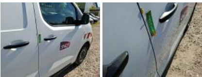
Boîtier rétroviseur ext D, Griffe(s), E - Remplacer