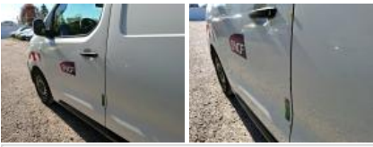
Panneau ARG, Bosse(s), LI - Réparer et peindre (complet)