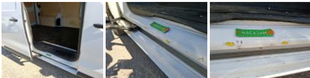
Joint de porte ARD, Dégrafé, Dépose/Repose