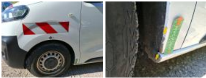
Bas de caisse ext G, Bosse(s) et griffe(s), LI - Réparer et peindre (complet)