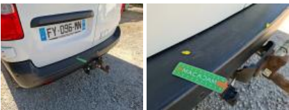
Porte de malle AR G, Eclat(s), Peindre