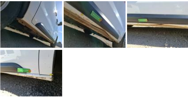
Panneau ARD, Griffe(s), Acceptable