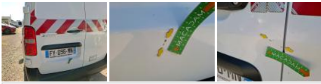
Pavillon cabine, Griffe(s), Peindre