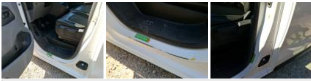
Revêtement assise siège AVG, Tache, Nettoyer