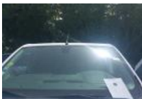
Pare-brise, Fêlure, E - Remplacer