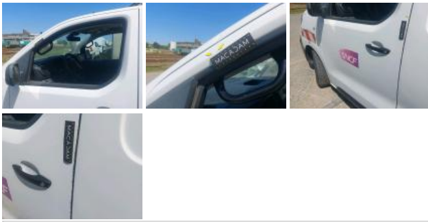
Boitier rétroviseur ext G, Cassé, E - Remplacer