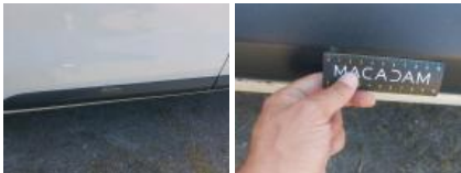
Bas de caisse ext D, Griffe(s), Peindre