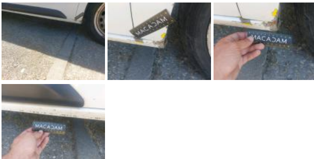
Porte AVD, Bosse(s) et griffe(s), LI - Réparer et peindre (complet)