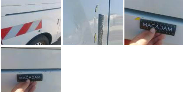
Moulure porte ARD, Griffe(s), Réparer/rempl. (montant forfaitaire)