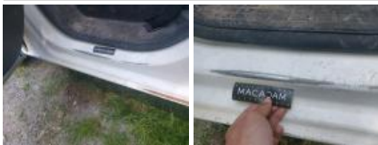
Garniture porte AVG, Griffe(s), Réparer/rempl. (montant forfaitaire)