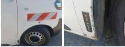
Porte de malle AR G, Bosse(s), LI - Réparer et peindre (complet)