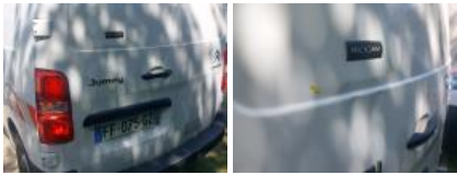
Pare-chocs AR, Déformé / Forcé, LI - Réparer et peindre (complet)