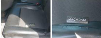
Revêtement dossier AVG, Tache, Nettoyer