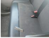
Revêtement dossier AVD, Tache, Nettoyer