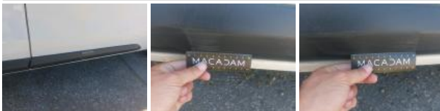
Bas de caisse ext D, Bosse(s) et griffe(s), LI - Réparer et peindre (complet)