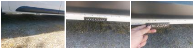
Moulure porte AVD, Griffe(s), E - Remplacer