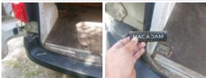
Passage de roue ARG, Bosse(s), LI - Réparer et peindre (complet)