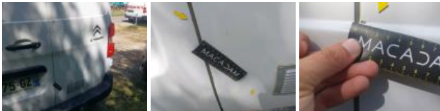
Joint de coffre/hayon, Déchirure, E - Remplacer