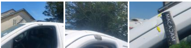
Porte AVG, Bosse(s) et griffe(s), LI - Réparer et peindre (complet)