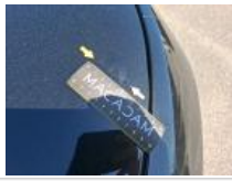
Pare-brise, Eclat(s), E - Remplacer