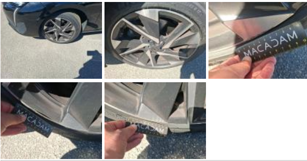
Jante alum. ARG bi-ton/polychrome, Griffe(s), Acceptable