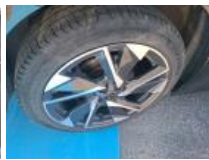
Kit réparation pneu, Manque, Réparer/rempl. (montant forfaitaire)