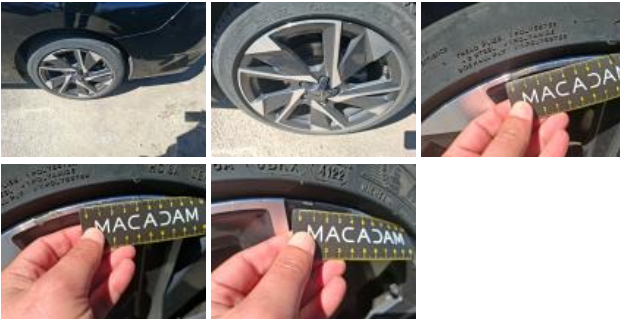
Pneu ARD, Hors tolérance, E - Remplacer