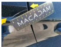
Porte ARD, Bosse(s) et griffe(s), LI - Réparer et peindre (complet)