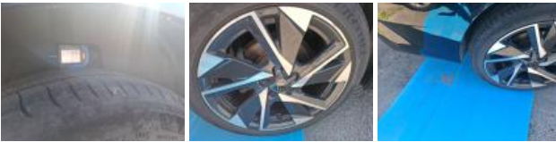
Jante alum. ARD bi-ton/polychrome, Griffe(s), Réparer/rempl. (montant forfaitaire)