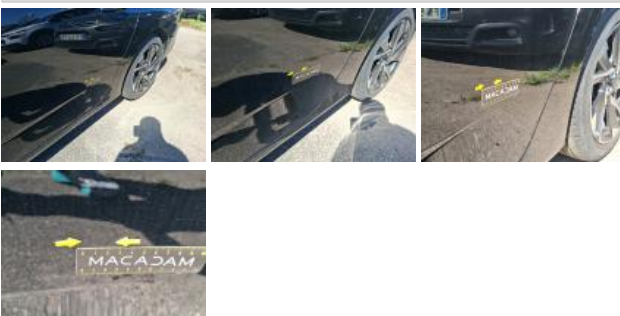
Capot, Griffe(s), Peindre