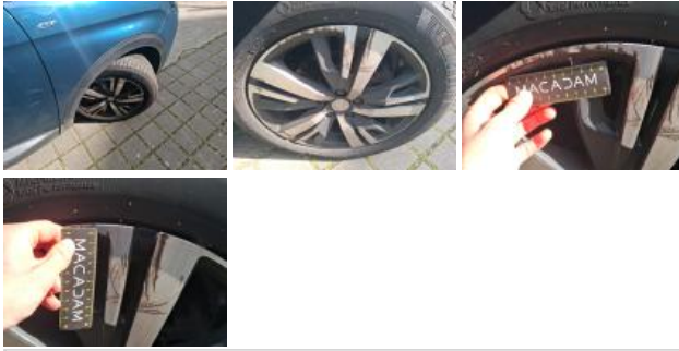
Jante alum. ARG bi-ton/polychrome, Griffe(s), Réparer/rempl. (montant forfaitaire)