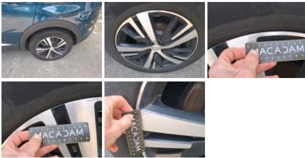
Jante alum. AVG bi-ton/polychrome, Griffe(s), Réparer/rempl. (montant forfaitaire)