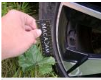
Pneu AVD, Déchirure, E - Remplacer