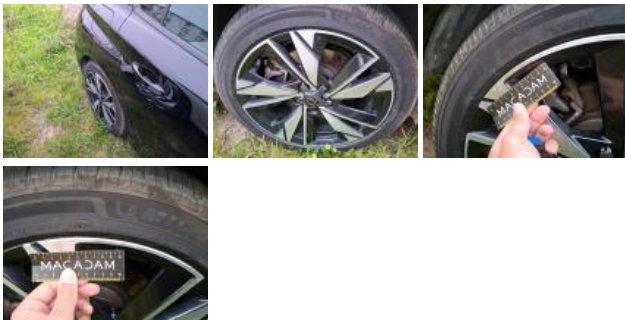
Jante alum. AVD bi-ton/polychrome, Griffe(s), Réparer/rempl. (montant forfaitaire)