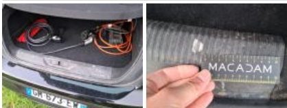
Garnit. couvercle AR, Griffe(s), Réparer/rempl. (montant forfaitaire)