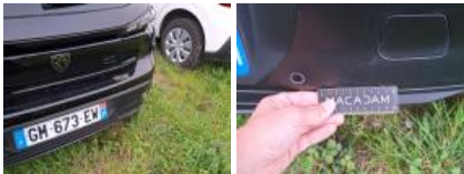
Pare-chocs AR, Griffe(s), Lustrage