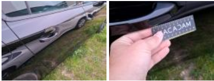
Jupe AR, Griffe(s), Acceptable