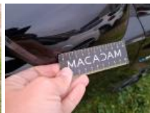
Porte AVD, Griffes(s), Acceptable