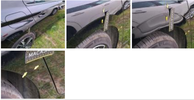
Poignée ext porte ARD, Griffe(s), Lustrage