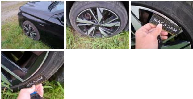
Jante alum. ARG bi-ton/polychrome, Griffe(s), Réparer/rempl. (montant forfaitaire)