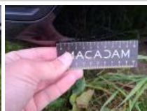
Aile AVD, Bosse(s) et griffe(s), Acceptable