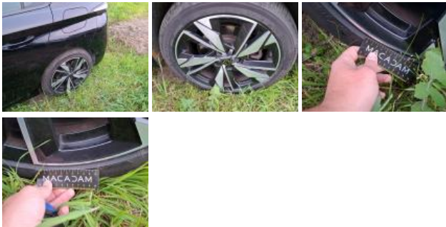
Jante alum. ARD bi-ton/polychrome, Griffe(s), Réparer/rempl. (montant forfaitaire)