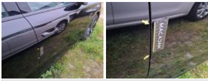
Aile ARD, Bosse(s), LI - Réparer et peindre (complet)