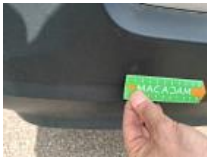
Carrosserie, Pas d'origine, Petit déletterage