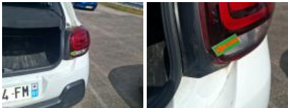
Pare-chocs AR, Griffes, E - Remplacer