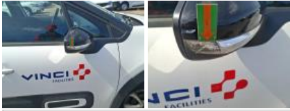
Aile AVD, Bosse(s), LI - Réparer et peindre (complet)