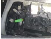
Kit réparation pneu, Manque, Réparer/rempl. (montant forfaitaire)