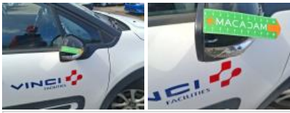
Répétiteur D, Fêlure, E - Remplacer