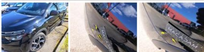
Aile ARG, Griffe(s), Lustrage