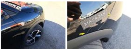
Pare-chocs AR, Griffe(s), Acceptable