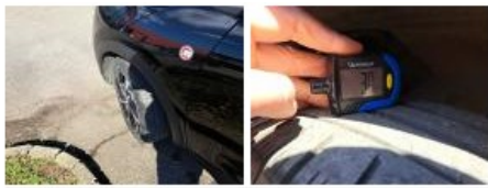
Pneu ARG, Hors tolérance, E - Remplacer