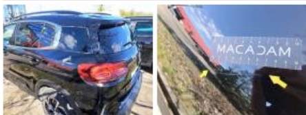
Pare-chocs AV, Griffe(s), Peindre