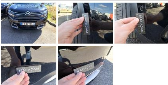
Spoiler AV, Griffe(s), E - Remplacer