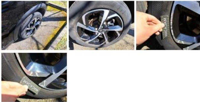
Pneu ARD, Hors tolérance, E - Remplacer