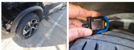
Jante alum. AVD bi-ton/polychrome, Griffe(s), Acceptable