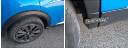
Moulure de pare-chocs AV, Griffe(s), Peindre