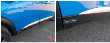
Moulure d'aile ARD, Griffe(s), Acceptable