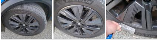
Pneu ARG, Hors tolérance, E - Remplacer